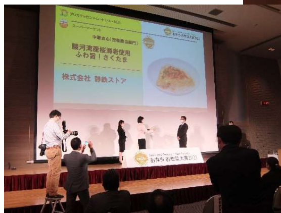
お弁当・お惣菜大賞表彰式