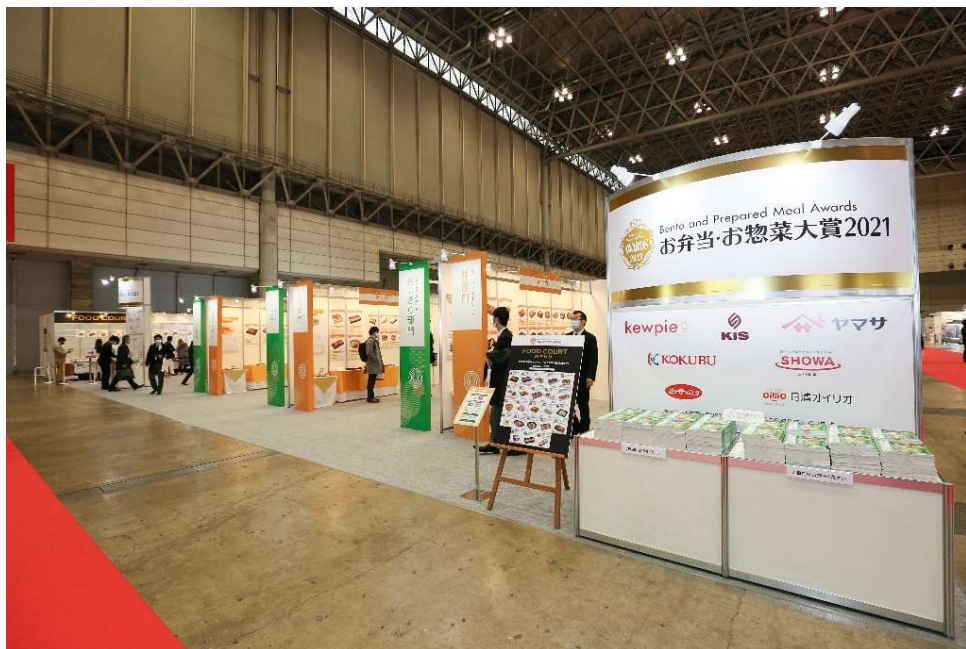
お弁当・お惣菜大賞展示ブース