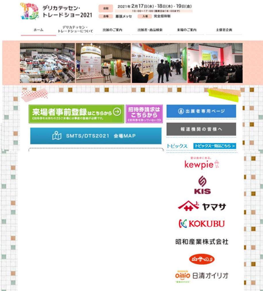
デリカテッセン・トレードショーWEBサイト