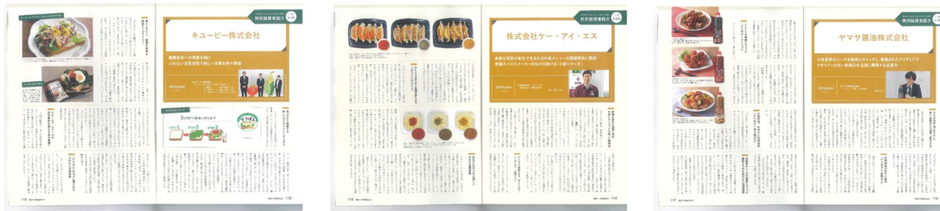
※画像は、前回の「惣菜デリ最前線2021」記事広告ページ