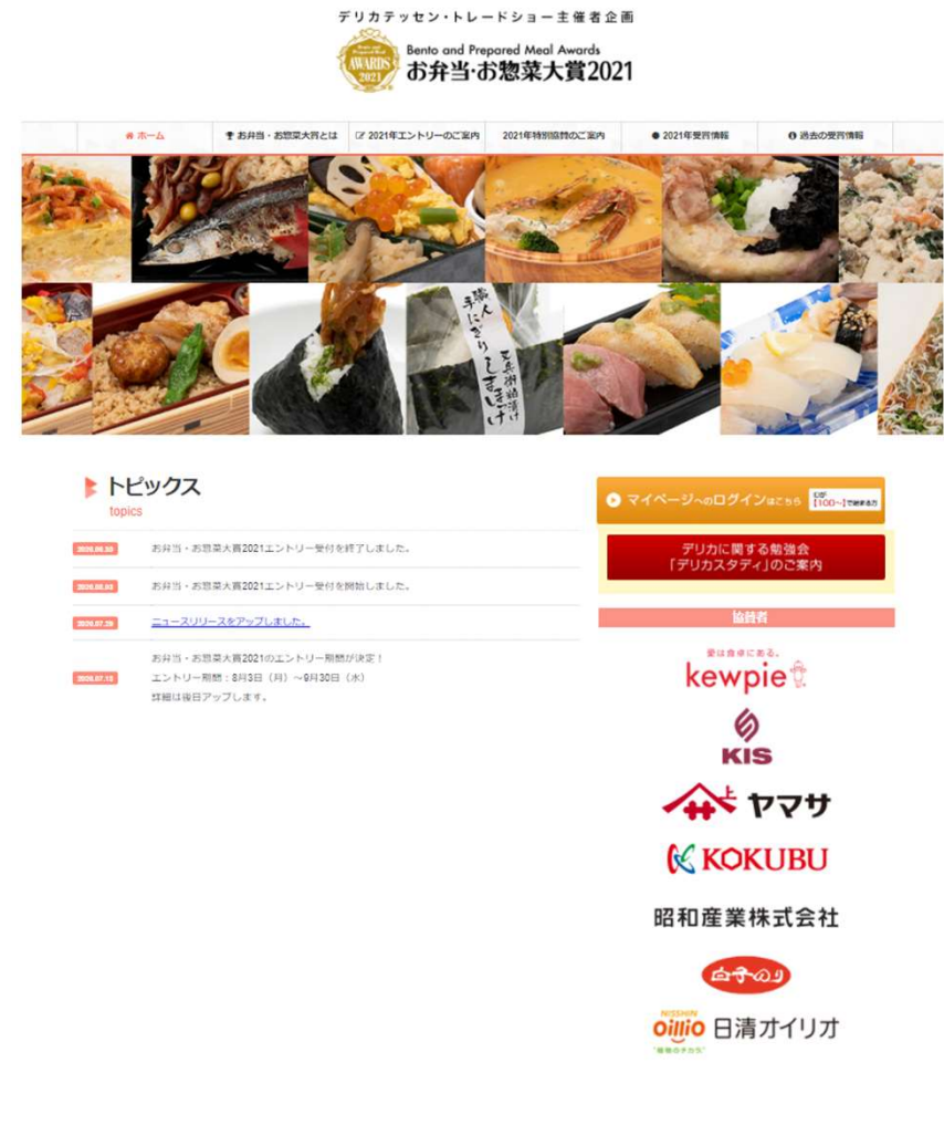
お弁当・お惣菜大賞WEBサイト